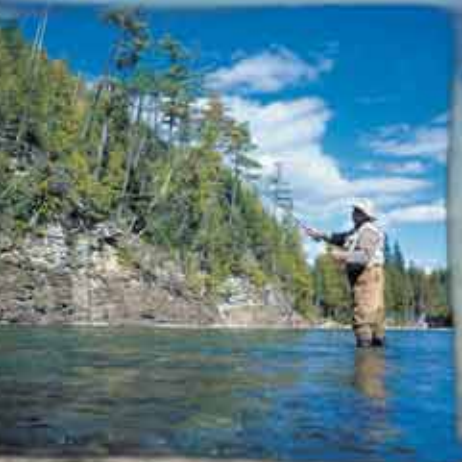
rivière Matane/Matane River