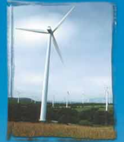
parc éolien/windmill park