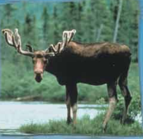
réserve faunique de Matane/Matane Wildlife Reserve