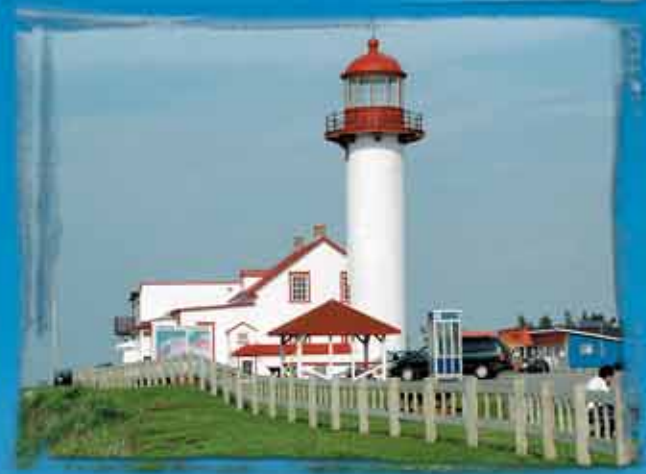
phare de Matane/Matane's lighthouse